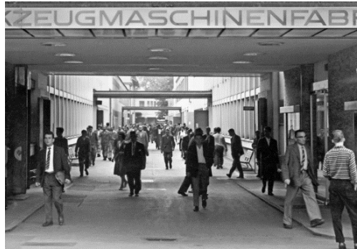
SWO Fabrikingang Birchstasse 155, Zürich / SWO Ingresso fabbrica.