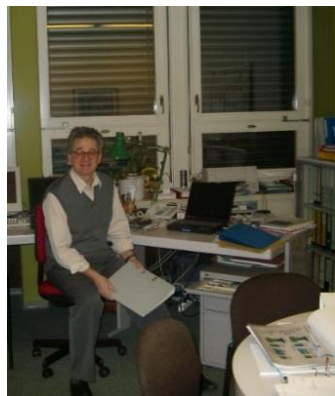
Entwicklungsarbeit 90er-Jahre / Lavoro di sviluppo anni '90

Die Entwicklungsabteilungen der SWO und der Contraves AG beschäftigten Techniker verschiedener Nationalitäten sowie italienische Ingenieure. Die Produkte waren vor allem Radaranlagen für terrestrische und marine Flugabwehr.