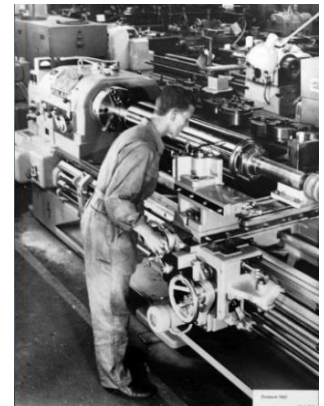
Drehbank / tornio SWO

A partire dagli anni '50 fino al 2000 molti italiani hanno lavorato nella SWO e nella Contraves AG. Più numerosi nei reparti di produzione, essi erano anche presenti negli uffici di costruzione e sviluppo dei prodotti.