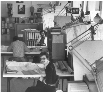
Mechanische Konstruktion Contraves 1975 / Contraves Ufficio costruzione 1975

La Werkzeugmaschinenfabrik Oerlikon-Bührle progettava e produceva dal 1937 fino al 2000 macchine utensili, macchine per la tessitura e sistemi d'arma. Del gruppo Bührle facevano parte anche la Pilatus di Stans e la Contraves AG.