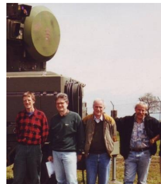
Radar Erprobung 1989 durch ein schweizerisch-italiensches Team Prove Radar 1989 team italiano e svizzero.

I reparti di sviluppo della SWO – Contraves AG erano multietnici e si avvalevano del lavoro di ingegneri italiani. I prodotti erano sistemi Radar di difesa antiaerea terrestri e navali.