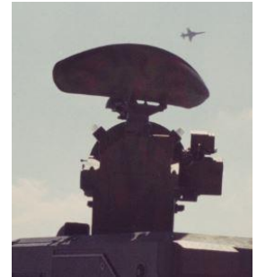
Skyguard 1985: Such- und Folge-Radar / Radar di ricerca ed inseguimento.

Die Werkzeugmaschinenfabrik Oerlikon-Bührle entwickelte und produzierte von 1937 bis 2000 Werkzeugmaschinen, Webmaschinen und Waffen-Systeme. Zum Bührle-Konzern gehörten auch die Pilatus Flugzeugwerke Stans und die Contraves AG.