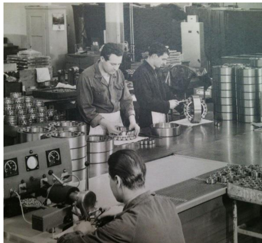
Montage / Montaggio