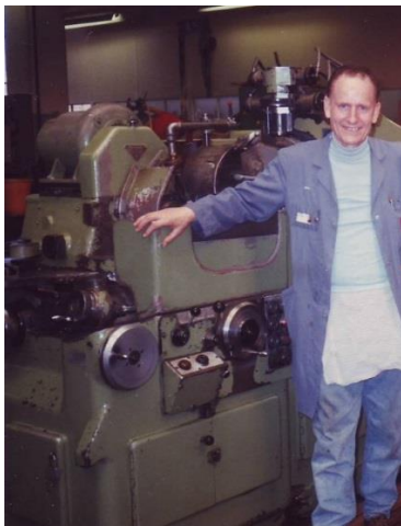
Werkzeugmaschinen / Macchine utensili

Qualità, precisione ed efficienza erano i tre concetti principali che governavano il settore della produzione. Negli anni '60 e '70, su 700 operai erano presenti in fabbrica ca. 150 italiani e 150 italiane. Gli uomini lavoravano nei reparti macchine utensili, le donne al montaggio e controllo.