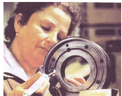
Kraftmesslager / Cuscinetto dotato di rivelatore di carico