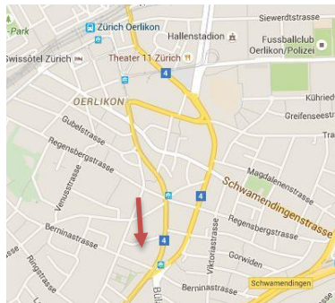
Standort der SRO am Berninaplatz / Sito della SRO, Berninaplatz