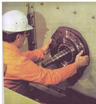
Installation / Messa in opera