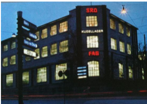
SRO FAG Hauptgebäude / Edificio principale