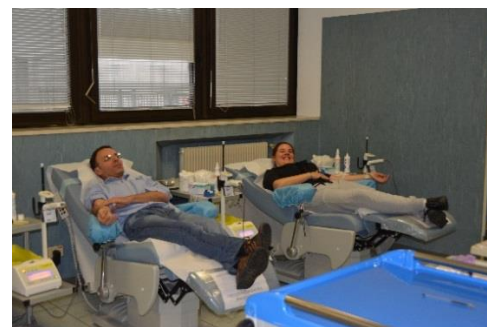
Blutspendezentrum / Centro trasfusionale

Con la sua organizzazione capillare e gli stretti contatti con gli emigrati italiani, l' Associazione Volontari Italiani del Sangue AVIS in Svizzera ha lo scopo di reclutare i donatori e invitarli a donare il loro sangue alla Croce Rossa Svizzera.