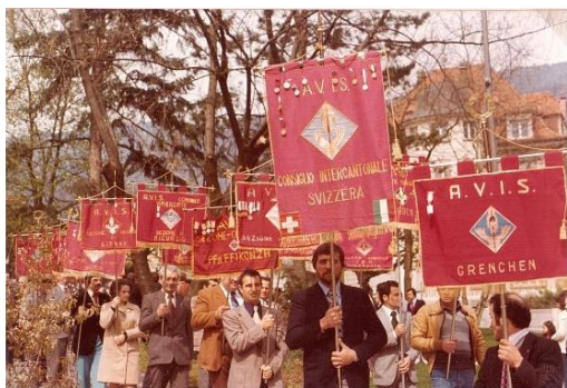
AVIS-Umzug / Sfilata AVIS

Der Italienische Blutspenderverband AVIS wirbt mit seiner engmaschigen Organisation und den engen Verbindungen zu den italienischen Einwanderern, die Blutspender zugunsten des Schweiz. Roten Kreuzes.