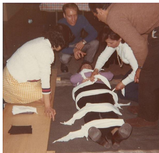
Praktische Übung / Esercitazione pratica

Der Italienische Samariterverein verfolgt in der italienischen Gemeinschaft die gleichen Zwecke wie die gleichnamige schweizerische Organisation. Unter anderem führt er Erste-Hilfe-Kurse für die Erlangung des Führerscheins durch und ist bei Anlässen der italienischen Gemeinschaft einsatzbereit.