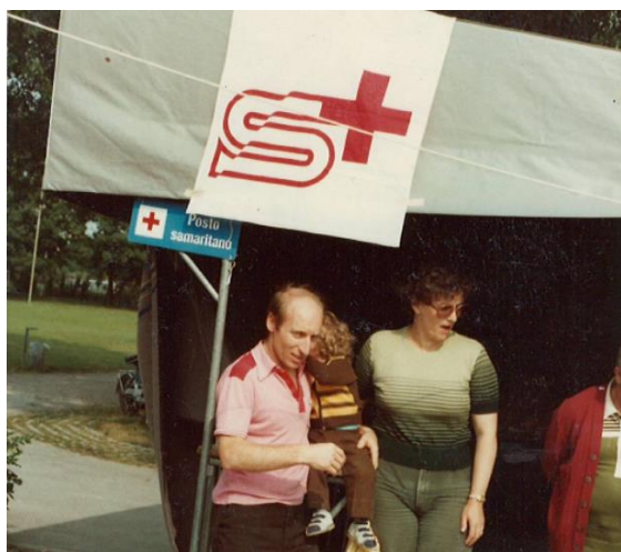
Bereitschaft an einem Anlass / Pronti all'intervento

L' Associazione Italiana Donatori di Organi AIDO contribuisce con la consorella svizzera al reclutamento di donatori di organi.