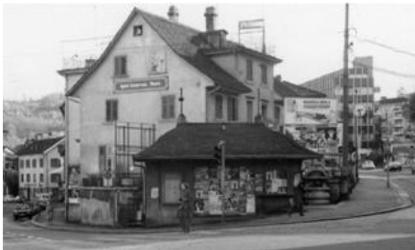
Restaurant Flora mit Gartenwirtschaft, Schaffhauserstrasse / Schwamendingenstrasse