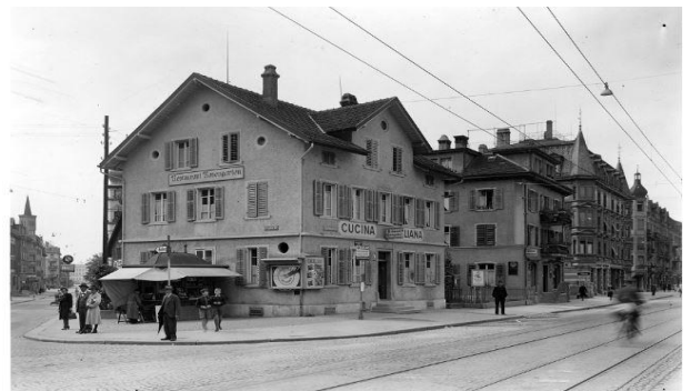
Restaurant Rosengarten, Schaffhauserstrasse / Franklinstrasse