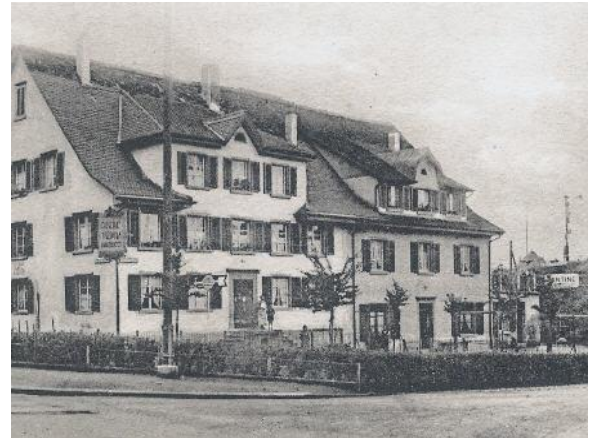
Restaurant Amaducci, Binzmühlstrasse 28

Die meisten Besucher dieser Restaurants waren Italiener. Fern von ihrer Heimat und meistens ohne Familie, waren diese Treffpunkte für alle sehr wichtig. Die Begegnung mit Bekannten aus derselben Region und denselben Dörfern waren für den Austausch über Arbeitsstelle, Verdienst, günstige Zimmer oder Kauf und Verkauf von Velos, Motorrädern und vieles mehr sehr wichtig. Jeden Abend ging es zu und her wie auf einem Marktplatz. Im Restaurant Amaducci entstand die erste Fürsorgeeinrichtung, die sich der sozialen Probleme der immigrierten Italiener annahm und zu helfen versuchte.