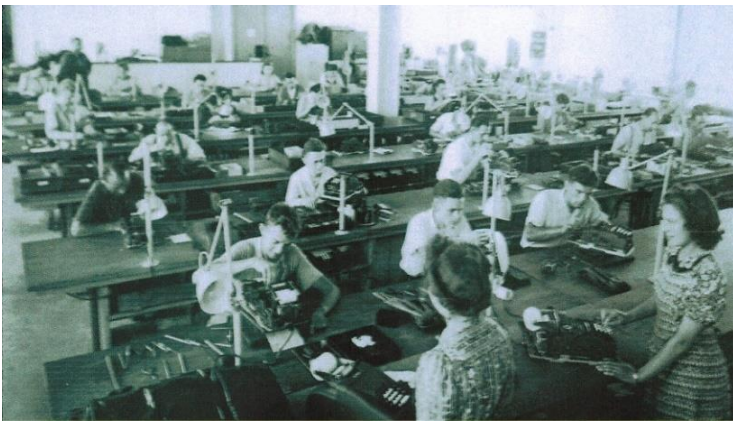
Montage von Rechenmaschinen Precisa / Montaggio di calcolatrici Precisa

Il boom dell'emigrazione avvenne a partire dall'immediato dopoguerra. In Italia, molti impianti industriali erano distrutti e regnava la disoccupazione. In Svizzera, invece, le industrie erano sovraccariche di lavoro e mancava il personale. Imprese grandi e medie si affrettarono ad assicurarsi il personale qualificato rimasto senza lavoro in Italia.