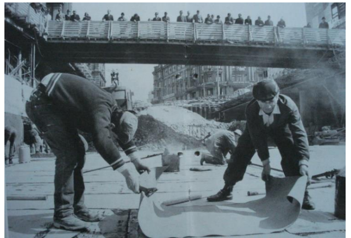
Bauarbeiter in Zürich / Lavoratori edili a Zurigo

Es gab aber noch eine andere, weniger bekannte Einwanderung: diejenige von Akademikern und Diplomierten. Neben der Ausübung ihrer Tätigkeit am Arbeitsplatz wurden sie als Lehrkräfte für die Weiterbildungskurse eingesetzt und spielten eine massgebliche Rolle bei italienischen Verbänden.