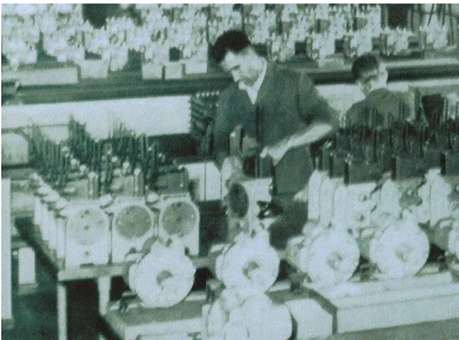
Montage von Oerlikon-Bremsen / Montaggio di freni Oerlikon