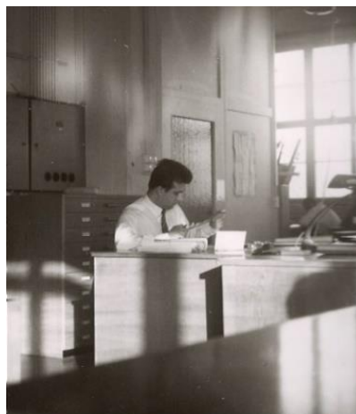
Technisches Büro / Ufficio tecnico

Es gab aber noch eine andere, weniger bekannte Einwanderung: diejenige von Akademikern und Diplomierten. Neben der Ausübung ihrer Tätigkeit am Arbeitsplatz wurden sie als Lehrkräfte für die Weiterbildungskurse eingesetzt und spielten eine massgebliche Rolle bei italienischen Verbänden.